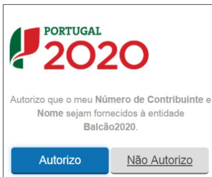
Figura 11 - SUBMISSÃO DE REPORTE DE EXECUÇÃO FÍSICA – AUTENTICAÇÃO AT

Deverá clicar no botão Autorizo para permitir a consulta dos dados ao Balcão 2020.