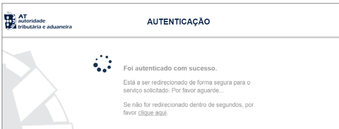
Figura 12 - SUBMISSÃO DE REPORTE DE EXECUÇÃO FÍSICA – AUTENTICAÇÃO AT

Deverá aguardar uns instantes pela Autenticação do Contribuinte.