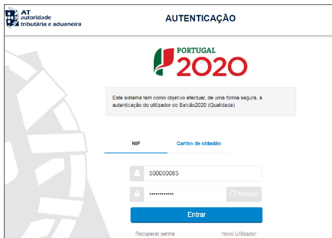
Figura 10 - SUBMISSÃO DE REPORTE DE EXECUÇÃO – AUTENTICAÇÃO AT

Deverá clicar no botão Autorizo para permitir a consulta dos dados ao Balcão 2020.