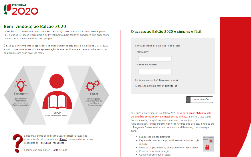
Figura 1 - PÁGINA INICIAL DO BALCÃO 2020

Depois da sessão iniciada, será possível aceder à Área Reservada.