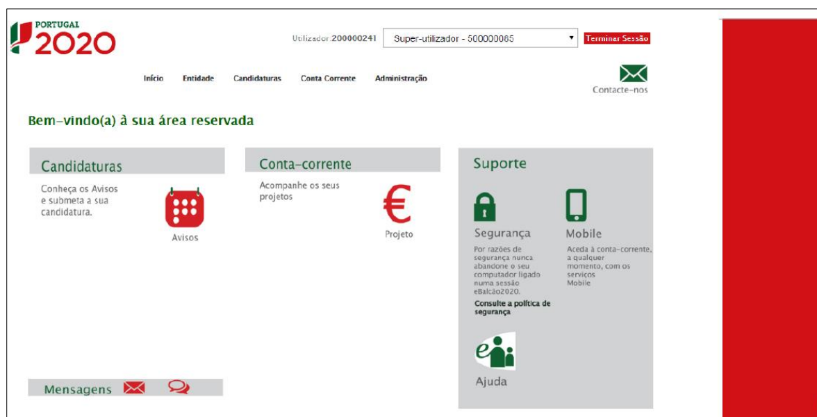
Figura 2 - PÁGINA INICIAL DA ÁREA RESERVADA – ENTIDADE

Depois da sessão iniciada, será possível aceder à Área Reservada.